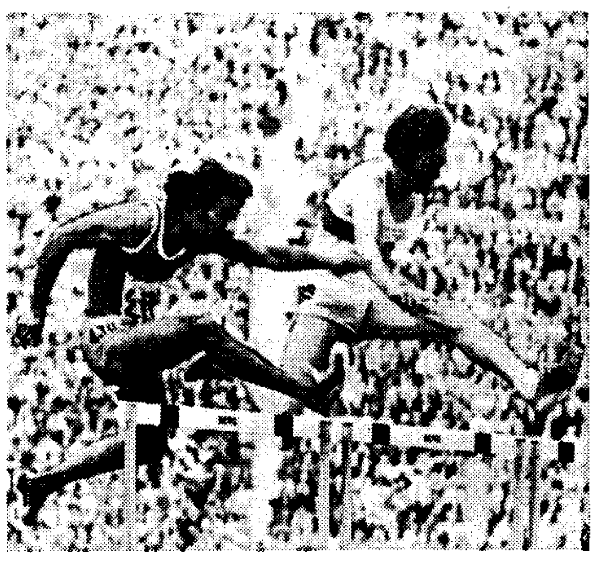
Χάρη στον φιλότιμο Κύπριο πρωταθλητή μας Σταύρο Τζιωρτζή, η 'Ελλάδα καταβύθισε, ύστερα από 36 ετών, να αποκλειστεί η δρόμος της στην εξέδρα των Ολυμπιακών Αγώνων...