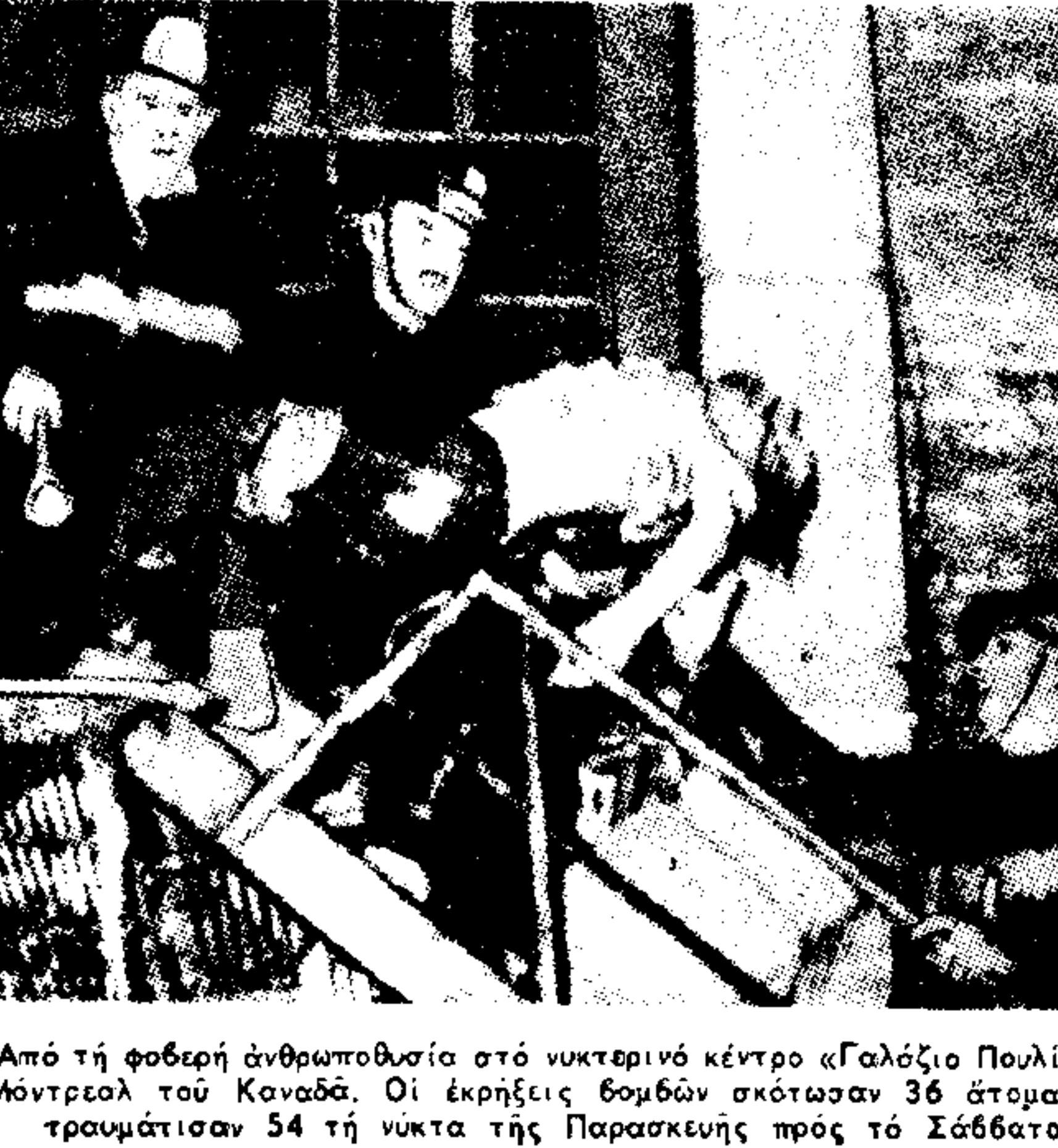
Από τη φοβερή ανθρωποθυσία στο κεντρικό κέντρο 'Γαλάζιο Πουλί' στο Μοντρεάλ...